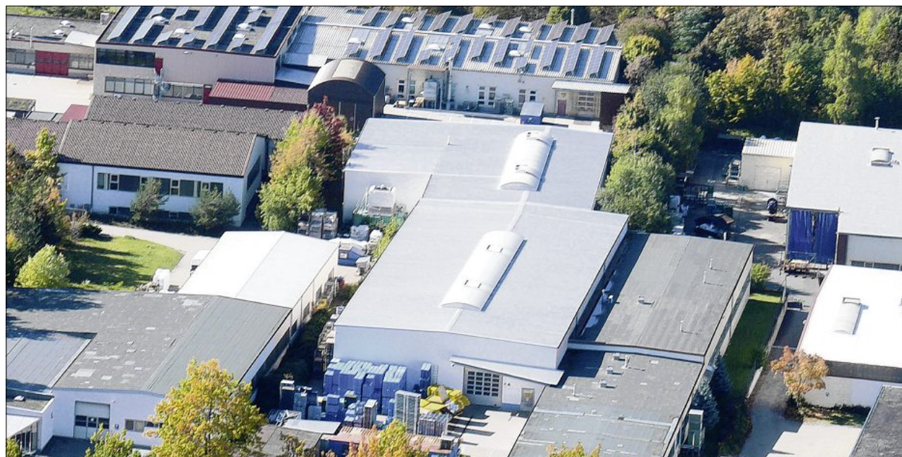
Die Firmengebäude des Schwabacher Unternehmens Wolf und Liegel, das Technoplast aus Wörth an der Donau übernommen hat.

Technoplast sei zwar von der allgemeinen Wirtschaftskrise betroffen gewesen, habe die Situation aber beispielsweise durch die Einführung von Kurzarbeit im Griff gehabt, so Bauer-Groißl. Nur so und durch gesundes Wachstum in den vorangegangenen Jahren sei es möglich gewesen, die Stammebelegschaft in Wörth zu halten und noch dazu die Übernahme von Wolf und Liegel zu stemmen. Die Unternehmerfamilie